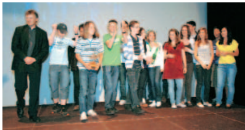
Zu Recht stolz: Die Klasse aus Unterägeri, die den ersten Rang belegte