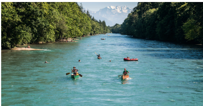
Il tragitto dell'Aare tra Thun e Berna è sicuramente uno dei più popolari per chi ama andare in gommone.

Quello che molti non sanno: anche per chi viaggia in gommone, in generale, vige un limite del tasso alcolico. Puntualmente a ridosso della nuova stagione balneare, la Consigliera federale Doris Leuthard e il suo Ufficio federale dei trasporti (UFT) hanno proposto di abolire questo limite. Il consumo illimitato di alcool – per molti indispensabile durante l'escursione in gommone – sarebbe, quindi, di nuovo lecito. Tuttavia, né l'Ufficio prevenzione infortuni (upl) né la Società Svizzera di Salvataggio (SSS) sono felici di questa proposta. Entrambi consigliano di non consumare alcool mentre si è in o sull'acqua. Ora si può solo aspettare se la proposta dell'UFT rimane valida in questa forma dopo la consultazione avvenuta presso i Cantoni, i partiti e le altre cerchie interessate.