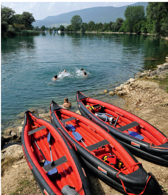
Una pausa è sempre una buona idea.