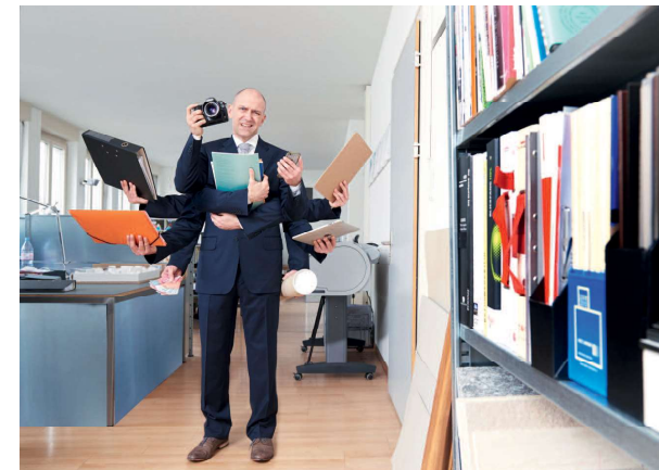
Ci si aspetta sempre di più da ogni singola persona.

Come promuovete la resilienza dei collaboratori nella vostra azienda? Quali elementi aiutano i dirigenti a creare team resilienti? In che modo i dirigenti possono rafforzare la resilienza